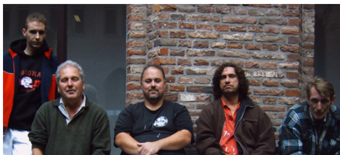
De mannen van de WEZO.

De benodigde verf werd bovendien ook nog eens door de WEZO gesponsord! Daar is De Bres natuurlijk erg blij mee. Een flinke opfrisbeurt voor de benedenverdieping is voor zowel gasten als vrijwilligers erg plezierig. WEZO: bedankt!